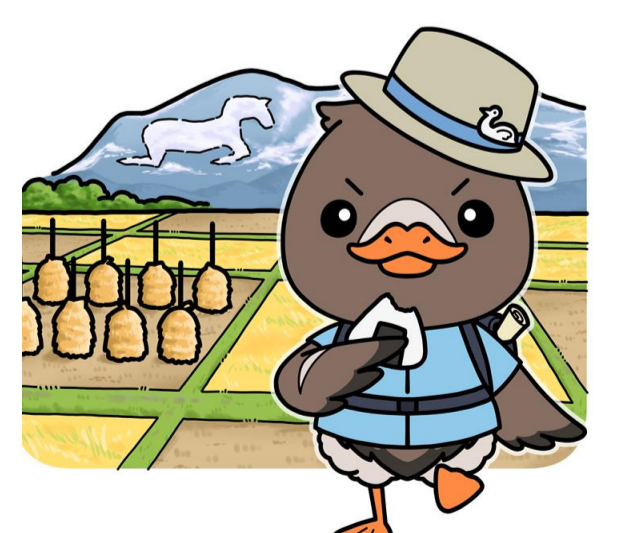
みやぎハローワークキャラクター ガンちょーさん