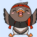
みやぎハローワークキャラクター ガンちょーさん